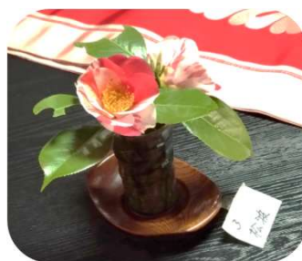
松波という品種のユキツバキがあり見せていただきました