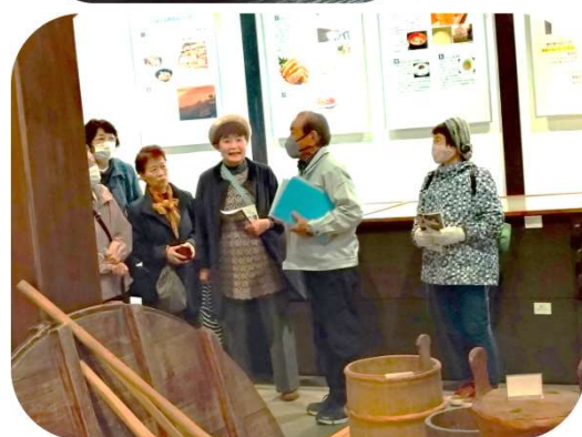
記念館の説明をお聞きしました