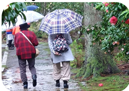
雨の中、傘を差しながらの散策もおつなもの