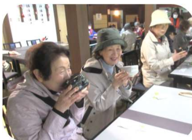
外に出なくても、抹茶をいただきながら中からゆっくり椿を眺められました