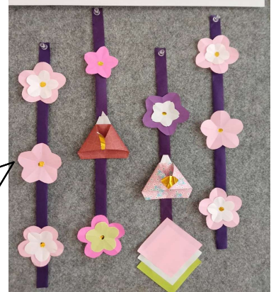
松波くらしのサポートセンター すず風の家(ひな祭)

三月の折り紙製作です。春らしいかわいい飾りですね。コミセンの玄関に飾ってあります。気づいた方いらっしゃいますか？