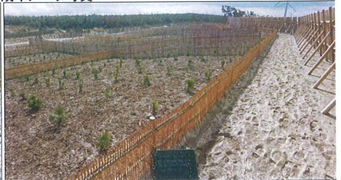
完成状況 潮風からクロマツを守る防風工、静砂工を設置してクロマツを植栽します。