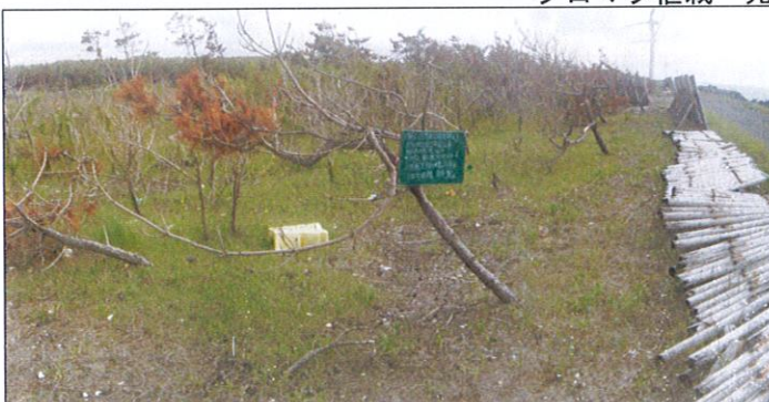
病害等によりクロマツ林が枯損し防風機能が低下しています。