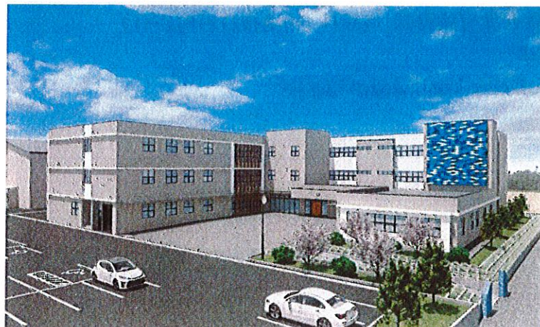
完成イメージパース(色彩は未決定)