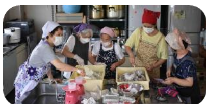
7月まつぼっくり食堂開店