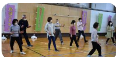
5月青空太極拳(雨の為室内)