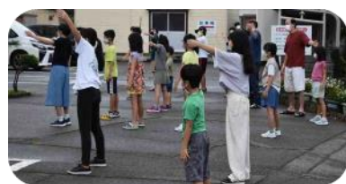
8月短い夏のラジオ体操