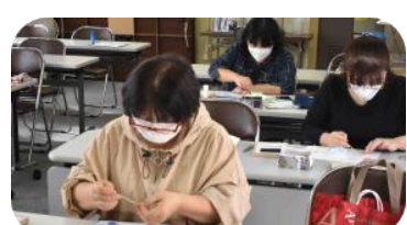
9月つまみ細工講座