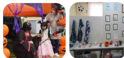
10月ハロウィーン&作品展