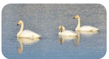
3月鯖石川の白鳥(旅立近し)