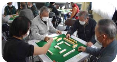
2月健康麻雀教室(男性が集合)