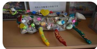
6月流木工作教室(完成作品)