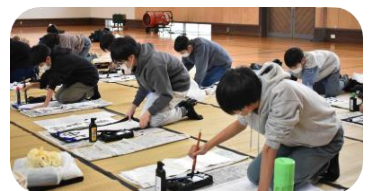
12月子ども書道教室