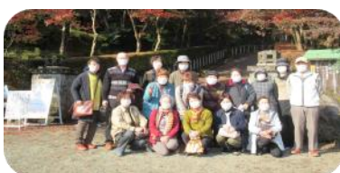
11月久々のコミバス研修