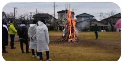
1月どんど焼き(無病息災)