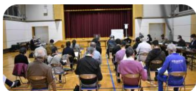
4月コミセン総会で活動開始