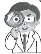
早期発見は進行後発見よりも5年生存率が高い