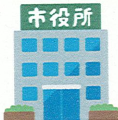
市役所 柏崎市役所 (道路維持課)