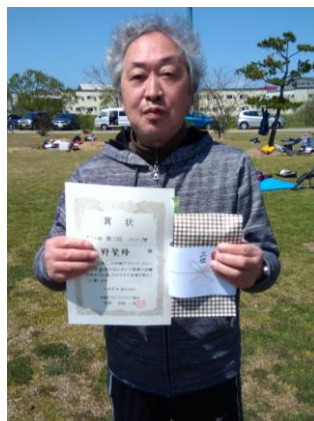
青空の下で表彰式