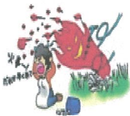
野焼きなどへの消防隊の警戒出場状況〈過去5年間〉