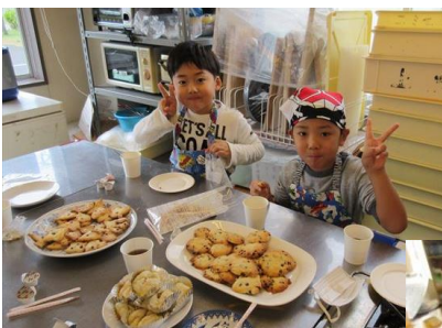
焼きたてクッキー 美味しいよ！