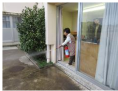
雨天のため室内からの消火訓練