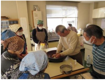
最初は名人さんによる実演！二八そばを打ちました