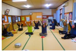
男性だけの体操会

会場 松波会館 火曜 10時 コミセン 水曜 10時 4丁目 集会場 木曜 10時