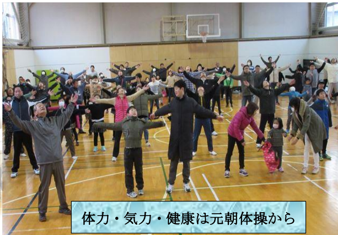
体力・気力・健康は元朝体操から

編集兼発行 松波コミュニティ協議会 新聞編集委員会 新潟県柏崎市松波2丁目 17番3号 ☎ 22-4352