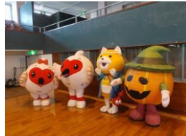
お友達ができたと！