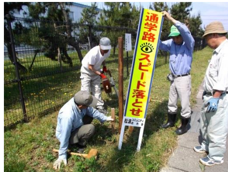
事故防止看板の新規設置風景

昨年実施出来なかった看板の補修と交換を5月30日に実施しました。破損のひどい物もありましたがきれいに改修し、これで皆さんの意識が高まれば良いと思っています。