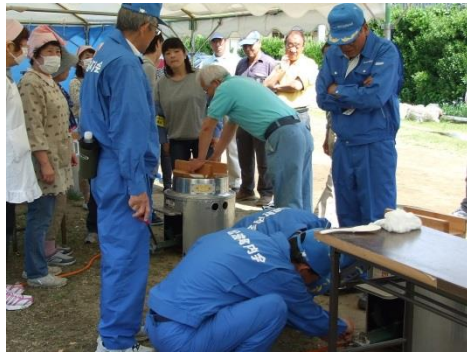
ちゃんと炊けるかな？水加減は？

大きな釜での炊飯に初めての人が多い、食生活改善推進員の皆さんの指導を受け悪戦苦闘しながらおいしいごはんを炊きあげました。その後おにぎりにして、お味噌汁と一緒に参加者に振舞われました。