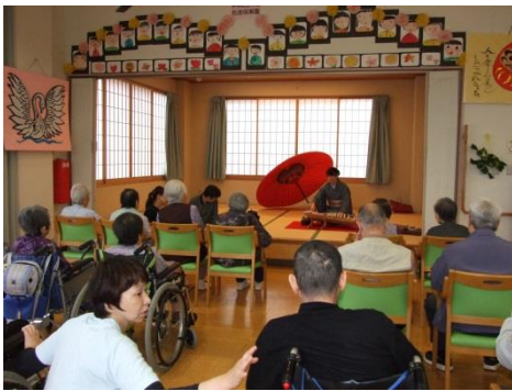
琴の音色にウツトリ

松波デイサービスセンターでお茶会が5月18日(月)から23日(土)の間開催されました。琴や大正琴の演奏に合わせ、抹茶と和菓子をいただき懐かしい唱歌や歌謡曲を聞きながら楽しいひと時を過ごしておられました。