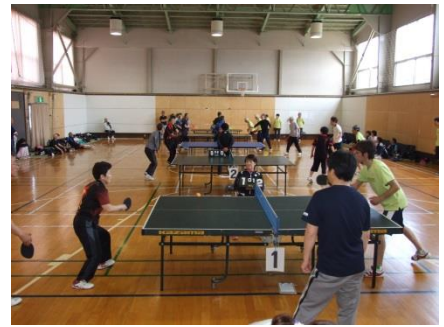
熱気ムンムン、やる気満々