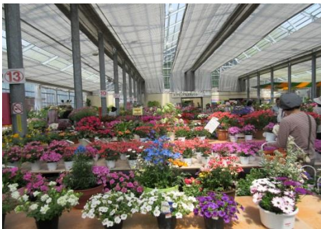
フラワーランドでお買い物

14名の部員と共に、コミセン事務局の担当者にご指導を頂き頑張りたいと思いますので、今後共よろしくお願い申し上げます。当部は町民の皆様の参加・協力が大変大事なことです。年間を通じ諸事業を次ページ「コミセン便り」でお知らせしますので、よくご覧になってご協力願えれば幸いです。