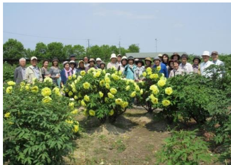
残っていたボタンの前で

つたためボタン園のボタンは見頃を終えていましたが、シャクヤクはともきれいでした。新津のフラワーランドでは、色とりどりの花木が販売されていて、皆さん思いの花を購入されました。今頃はご家庭のお庭がにぎわっていることでしょう。